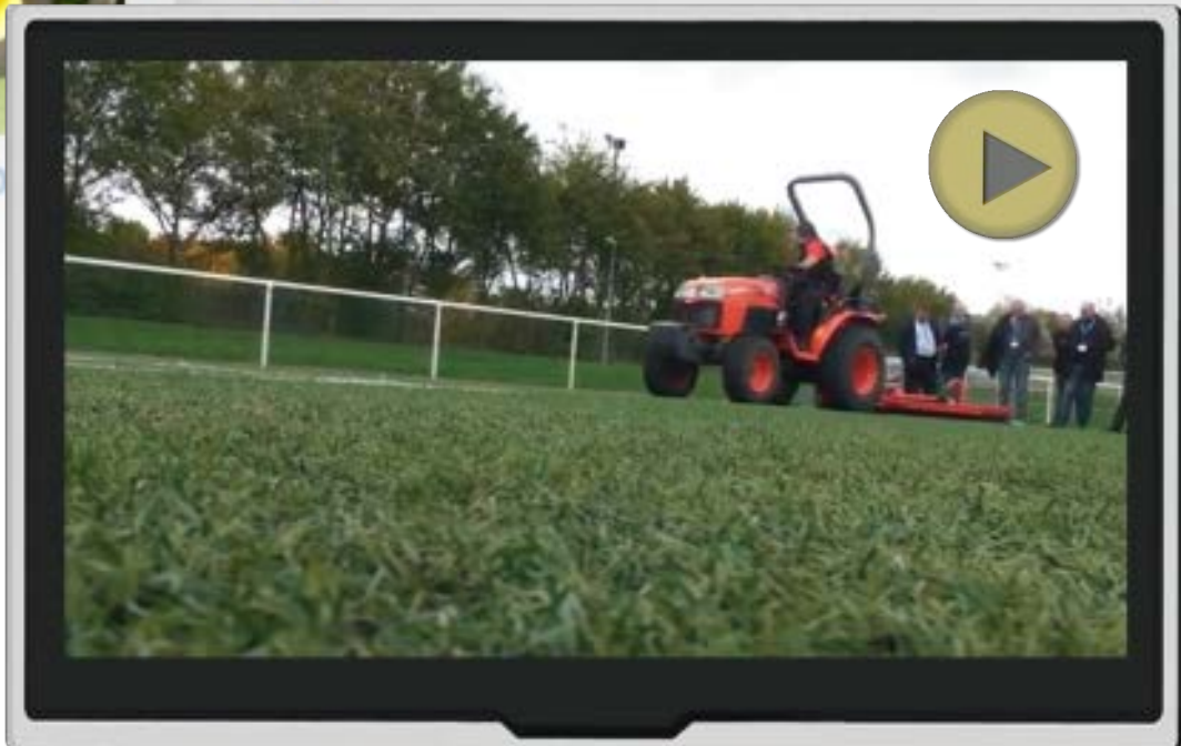
Wiedemann TERRA GROOM

Wiedemann gilt als einer der technologisch führenden Hersteller weltweit. Die Maschinen haben zahlreiche Innovations- und Leistungspreise gewonnen und zeichnen sich unter anderem durch ihre hohe Produktivität aus: Der Zeitaufwand bei typischen Arbeitsaufgaben könne sich im Vergleich zu anderen Geräten auf die Hälfte reduzieren, gibt