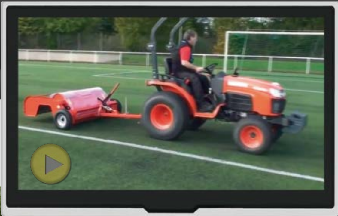
Wiedemann TERRA CLEAN 100